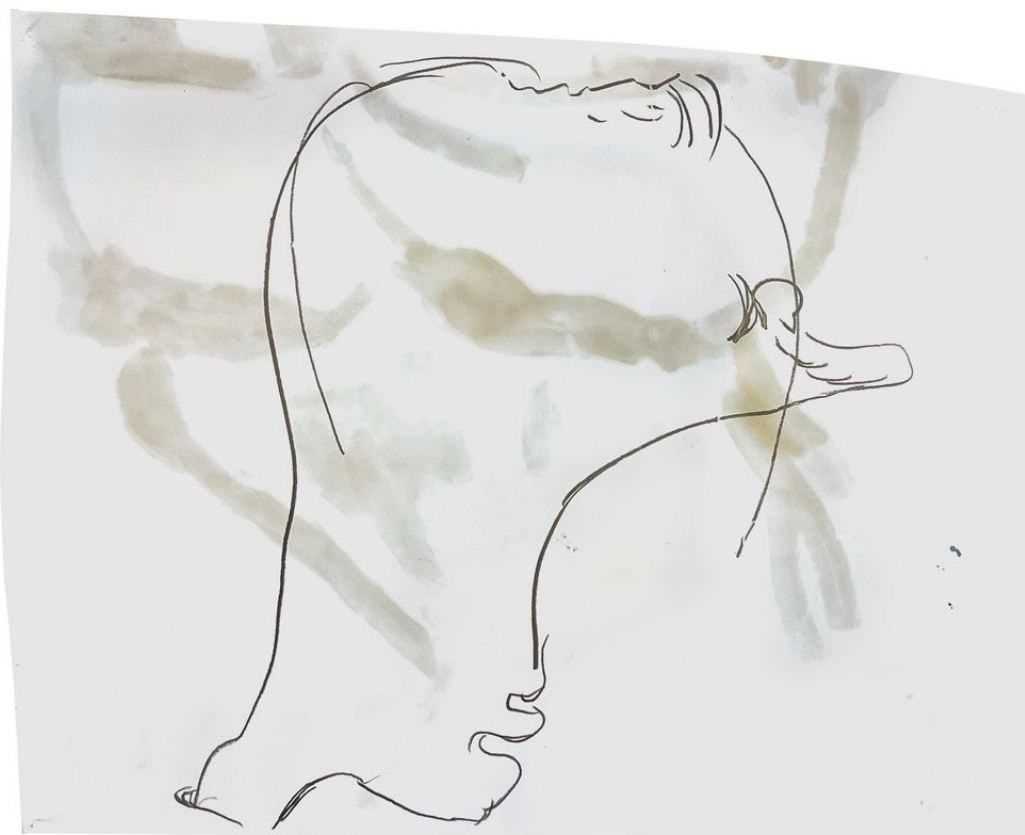
Heiner Franzen GESICHTSFELD 2023 Pencil on paper in plexiglas frame 55 x 75 x 3 cm