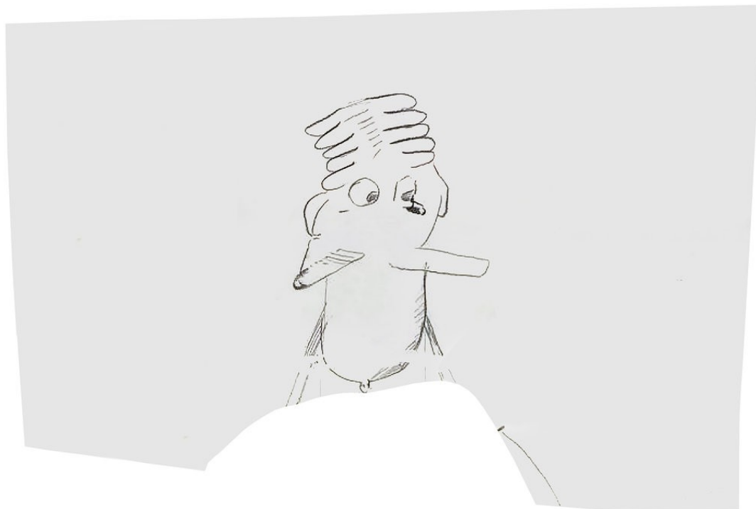
Heiner Franzen GESICHTSFELD 2021 Pencil on paper in plexiglas frame 67.5 x 98.5 x 3 cm