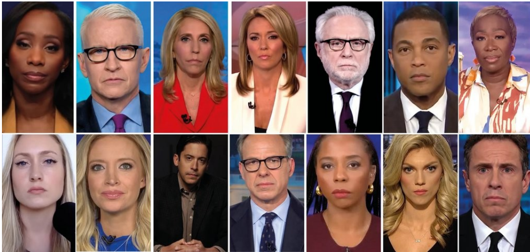
Heiner Franzen ANCHORS 2024 Video installation Loop, variable installation Edition 1/5 plus 1 AP