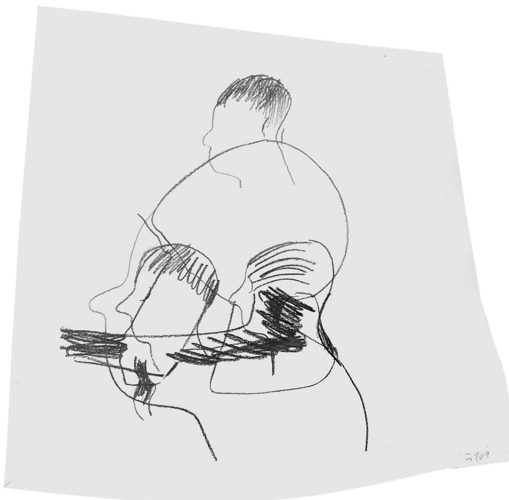
Heiner Franzen GESICHTSFELD 2019 Pencil on paper in plexiglas frame 65 x 68 x 3 cm