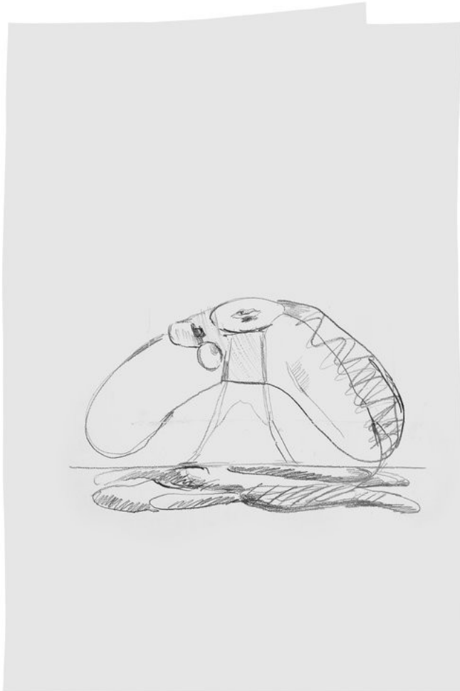
Heiner Franzen GESICHTSFELD 2022 Pencil on paper in plexiglas frame 99.5 x 72.5 x 3 cm