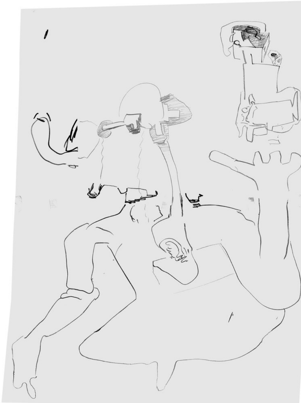
Heiner Franzen GESICHTSFELD 2022 Pencil on paper in plexiglas frame 125 x 95 x 3 cm