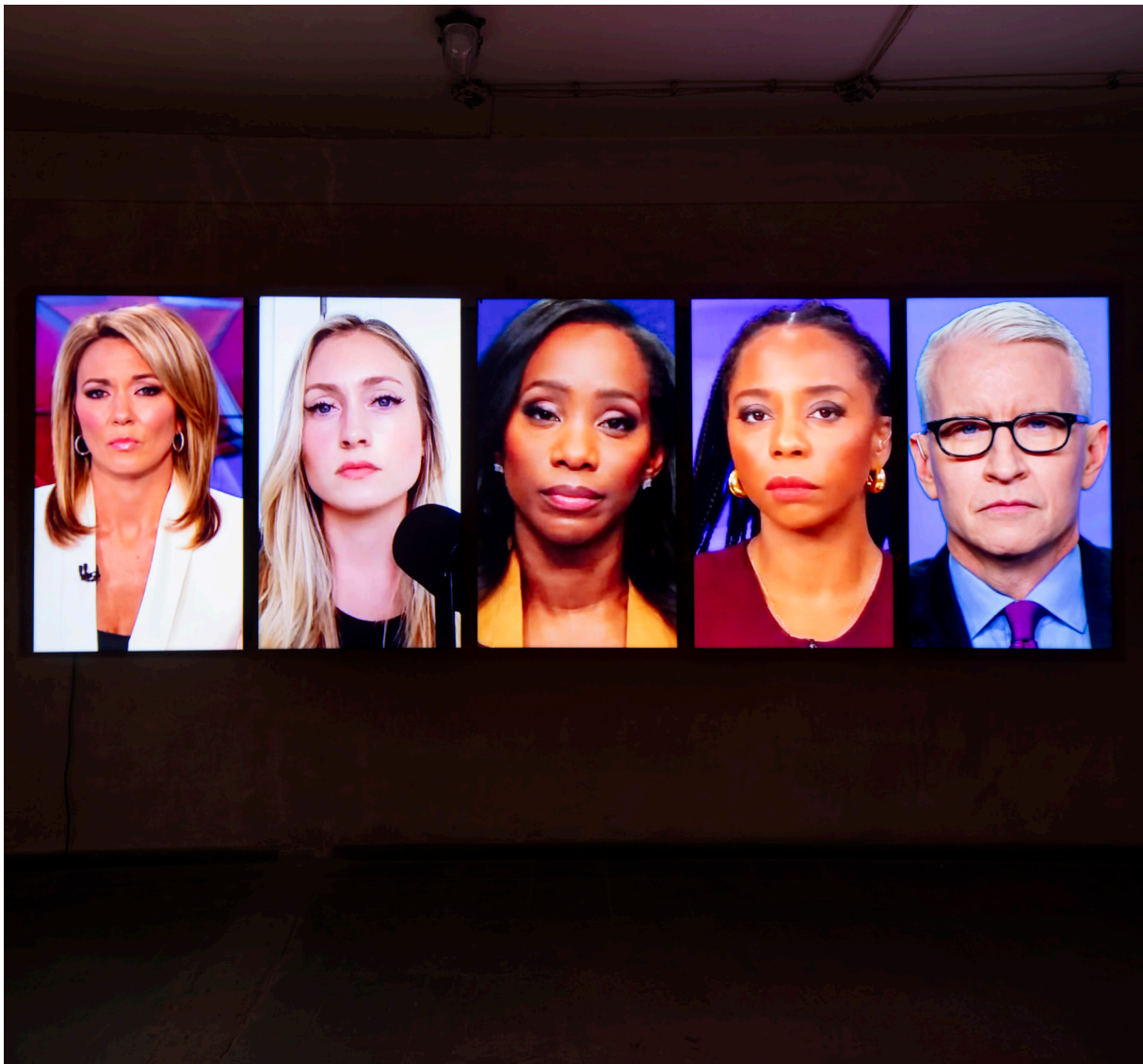
Installation view, Heiner Franzen, ANCHORS , 2024, Ebensperger Berlin

EBENSPERGER +49 030 20929150 office@ebensperger.net