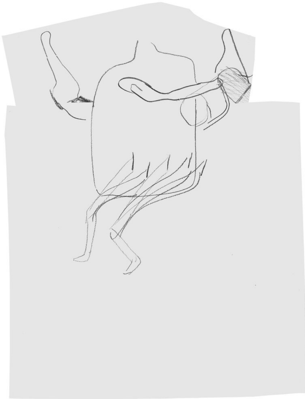
Heiner Franzen GESICHTSFELD 2019 Pencil on paper in plexiglas frame 93 x 65 x 3 cm