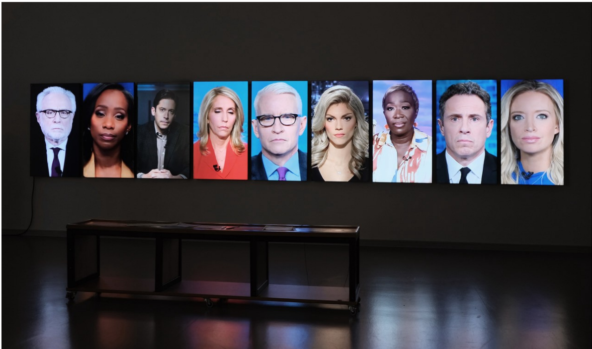
Heiner Franzen ANCHORS 2024 Video installation Loop, variable installation Edition 1/5 plus 1 AP Photo: Installation view at Kunsthalle Barmen 2024