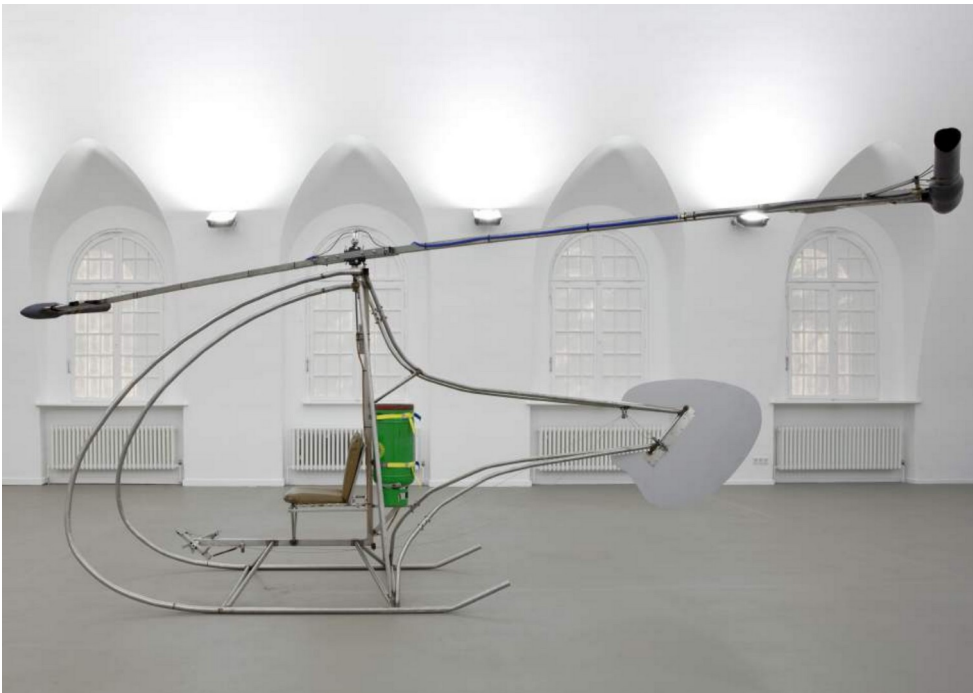
David Moises -HUI- Hubschrauber 2006 Gluhareff jet engines, stainless steel frame, various mechanics, propane cylinder 235 x 150 cm Ø 620 cm unique