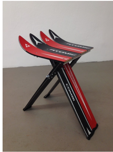
David Moises Schihocker 2024 Various skis ca. 62 x 47 x 34,5 cm Unique